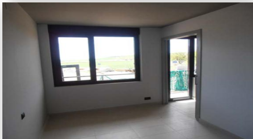
Habitación. Vista cara sur