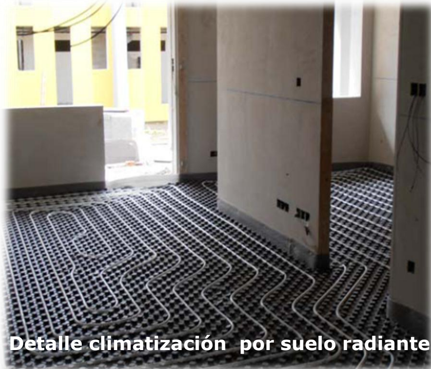
Detalle climatización por suelo radiante

El edificio ha logrado el 2º premio Endesa a la arquitectura sostenible .