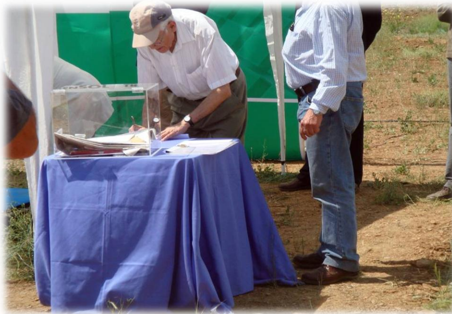
Primera piedra. Mayo 2011