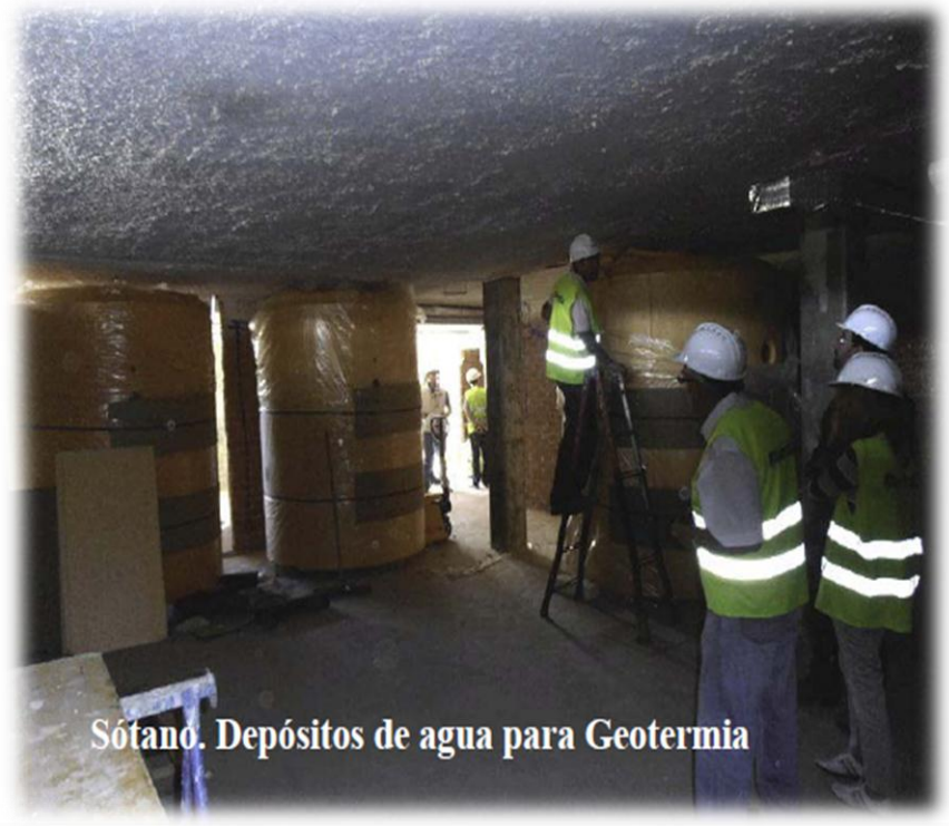
Sótano. Depósitos de agua para Geotermia